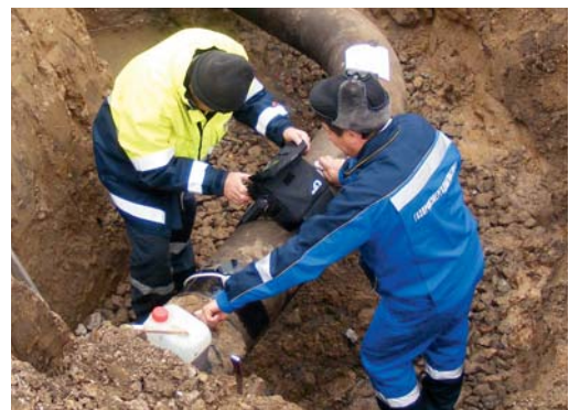
Gemeinsam arbeiten, voneinander lernen: VNG-Mitarbeiter und ihre russischen Kollegen bei der Diagnose von Sondenleitungen auf Untergrundgasspeichern.