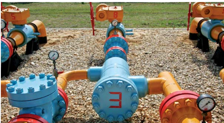
Beispiel eines Ejektors auf dem UGS Peszano-Umjotskoje.

Ein weiterer Vertrag zur technischen Diagnose von Sondenleitungen und Förderrohrtouren auf Untergrundgasspeichern wurde mit der OOO „Gazpromenergodagnostika“ geschlossen. Ziel war es, mit Unterstützung der russischen Experten,