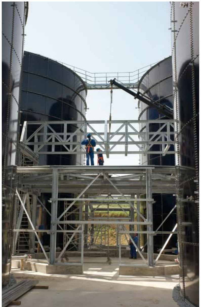
Derzeit noch im Bau, aber bald schon wird die Anlage in Teterow in Betrieb gehen. Weitere Projekte – auch für die Erzeugung von BioErdgas – sind bei der EnD-I AG bereits in Planung.

In welche Richtung die Führung des Biogas-Unternehmens sich entwickeln will, zeigt ein jüngstes Joint Venture mit der in Koblenz ansässigen