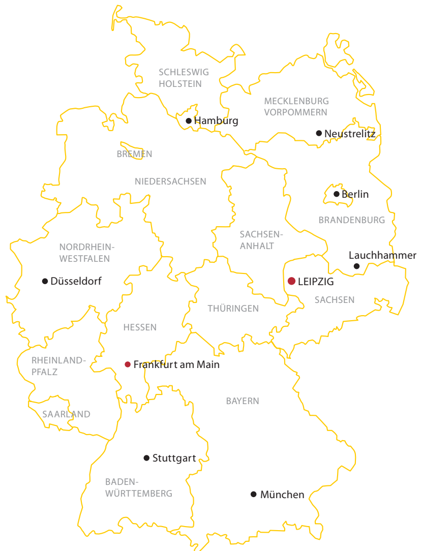
Die Vertriebsbüros der VNG in Deutschland

VNG – Verbundnetz Gas Aktiengesellschaft Gasverkauf Postfach 24 12 63 | 04332 Leipzig Telefon +49 341 443-2554 Fax +49 341 443-2296 E-Mail gasverkauf@vng.de